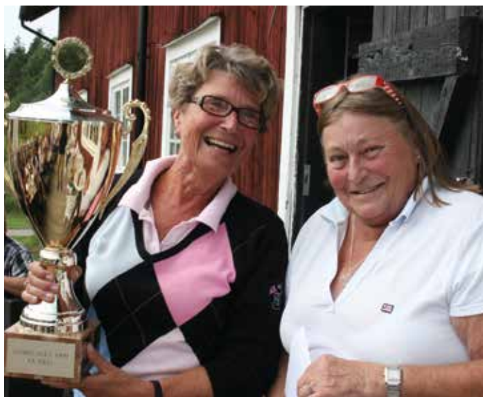
Ny säsong, nya bucklor.

... och med den så kommer golfsäsongen. Den som vi har drömt om ett tag nu. Vi börjar den 13 maj med tisdagsgolfen för damerna. Klockan tio som vanligt. I år ska vi ha fler tisdagstävlingar då alla behöver fyra resultat att lämna in till golfklubben.