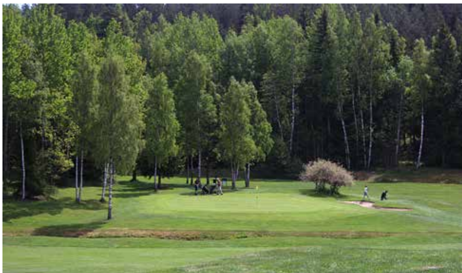
Hur det än blir så blir det en bra golfsommar. Välkommen till den!

Damerna har ett eget tävlingsprogram på tisdagar och herrar H65+, H75+ på torsdagar. En matchtävling från gul tee kommer att spelas under hela säsongen.