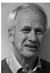
Välkommen till årets tävlingar

Glöm inte att registrera dina golfvänner i GIT systemet, 4 rundor under de senaste 12 månaderna krävs för att kunna ta emot pris i någon av våra tävlingar.