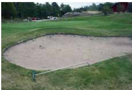
Bättre att lägga krattan rätt än att spela som en. Denna ligger fel!