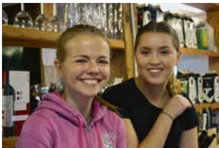
Den flinka personalen serverade 1035 mat bara i juni.

Inför säsongen klistrade vi på alla bunkerkrattorskaft en textremsa som informerar om att hela krattan ska placeras i bunkern i spelriktningen. För att undvika att krattskaften blir sandiga och för att de ska vara lätta att få tag i utan att gå ner i bunkern, har de en