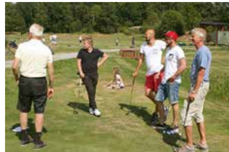
Full fart på Golfens Dag.