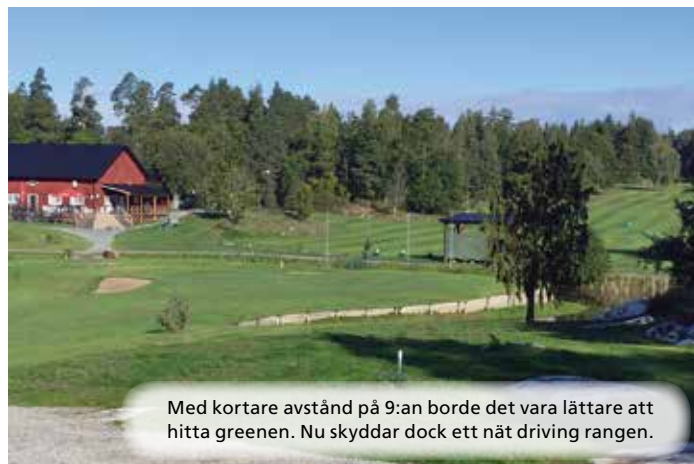
Med kortare avstånd på 9:an borde det vara lättare att hitta greenen. Nu skyddar dock ett nät driving rangen.