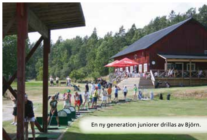
En ny generation juniorer drillas av Björn.